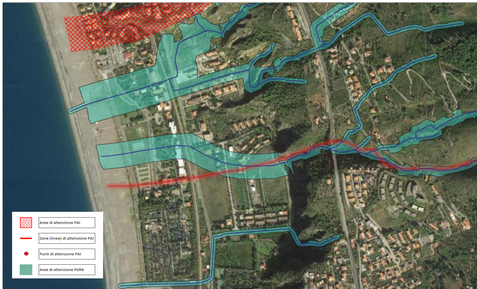
Piano Stralcio di Assetto idrogeologico dell'ex ABR Calabria - rischio idraulico - Comune di Praia a Mare (CS)- ambito 3 - Torrente Cavaliere -Piano vigente