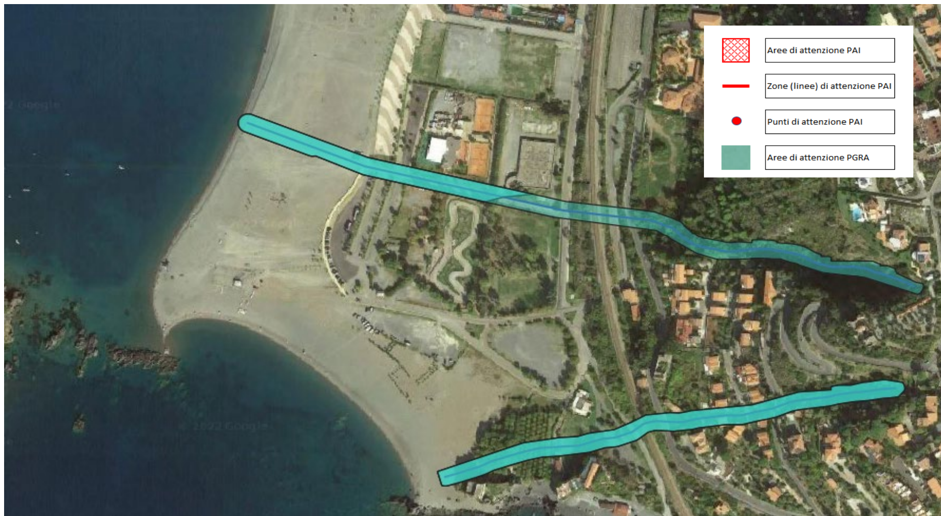
Piano Stralcio di Assetto idrogeologico dell'ex ABR Calabria - rischio idraulico - Comune di Praia a Mare (CS) - ambito 4 - Fossi minori - variante di aggiornamento