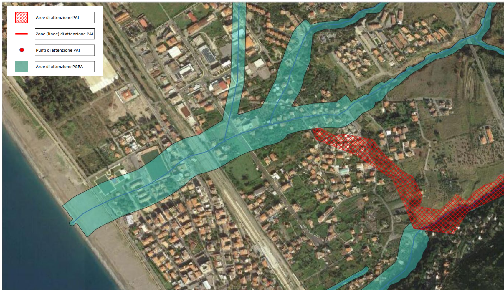
Piano Stralcio di Assetto idrogeologico dell'ex ABR Calabria – rischio idraulico -Comune di Praia a Mare (CS) ambito 1 - Torrente Gelsi - variante di aggiornamento