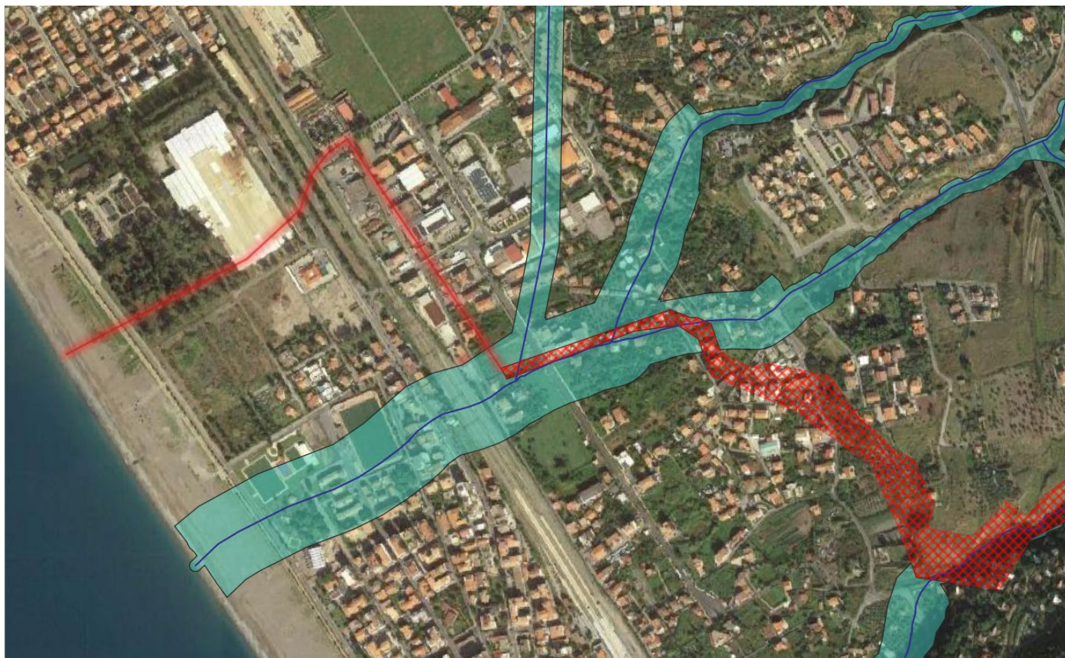
Piano Stralcio di Assetto idrogeologico dell'ex ABR Calabria – rischio idraulico -Comune di Praia a Mare (CS) ambito 1 - Torrente Gelsi -Piano vigente