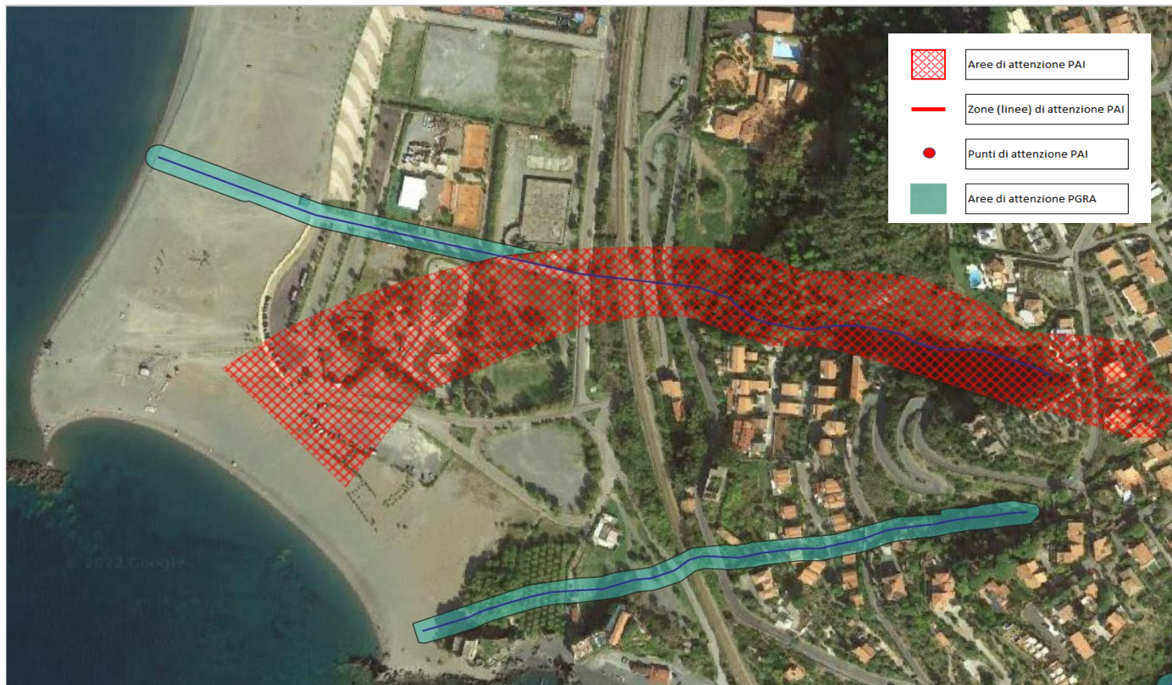
Piano Stralcio di Assetto idrogeologico dell'ex ABR Calabria - rischio idraulico - Comune di Praia a Mare (CS) - ambito 4 - Fossi minori - Piano vigente